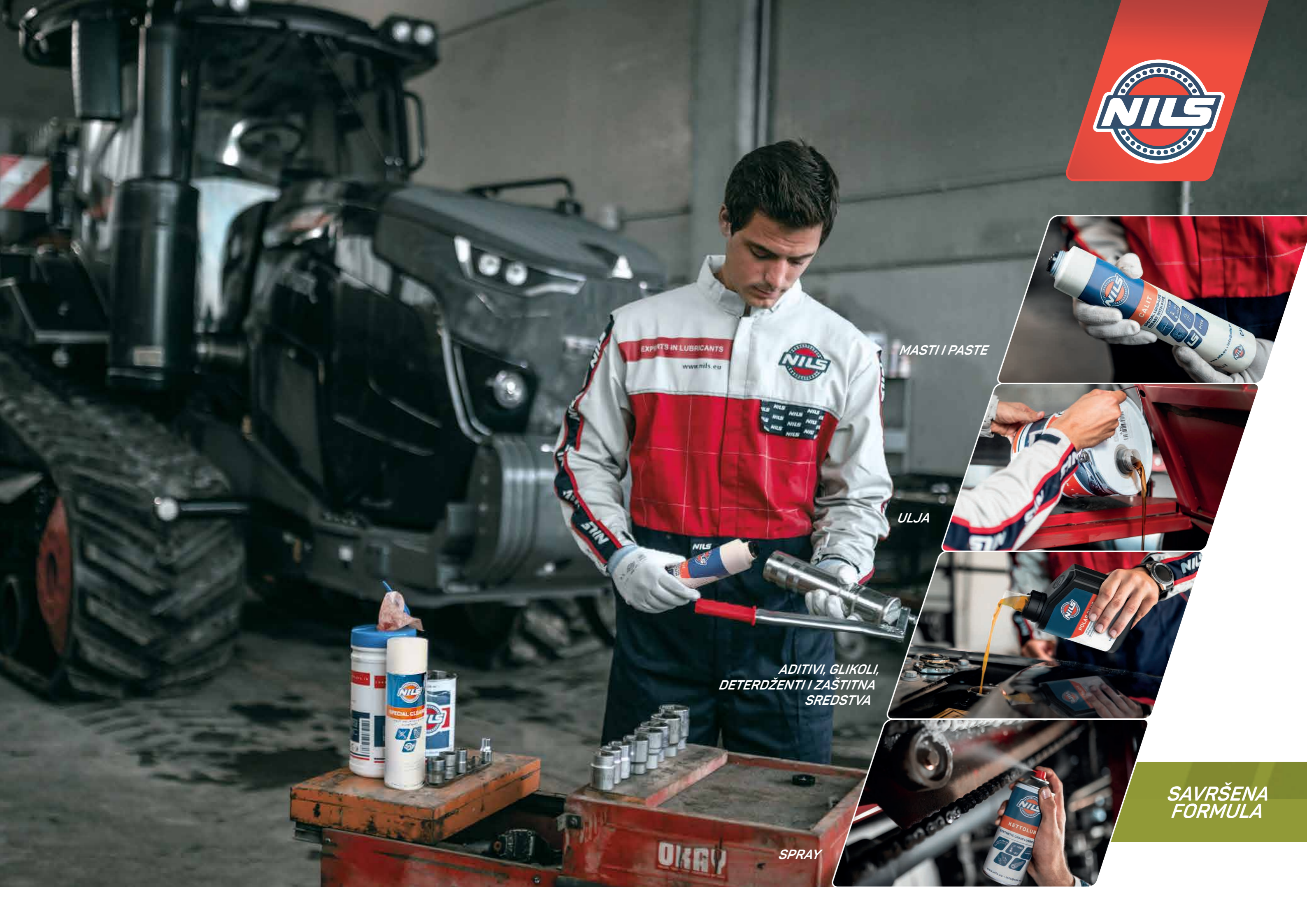
MASTI I PASTE